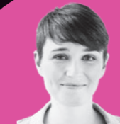
SIGI MAURER Aktivistin gegen Hass im Netz