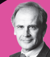
PAUL SEVELDA Präsident Österreichische Krebshilfe